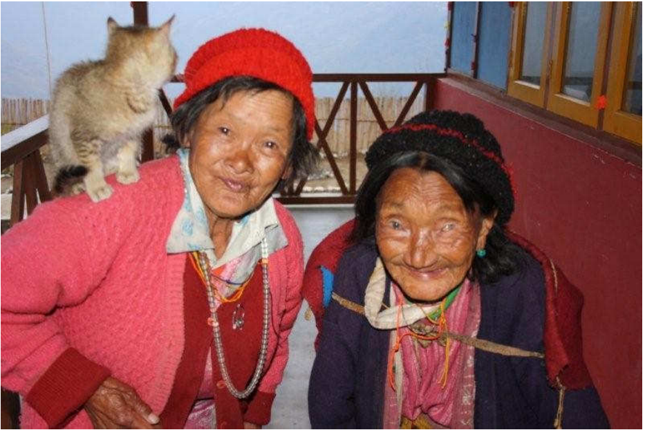
in liebevollem Miteinander