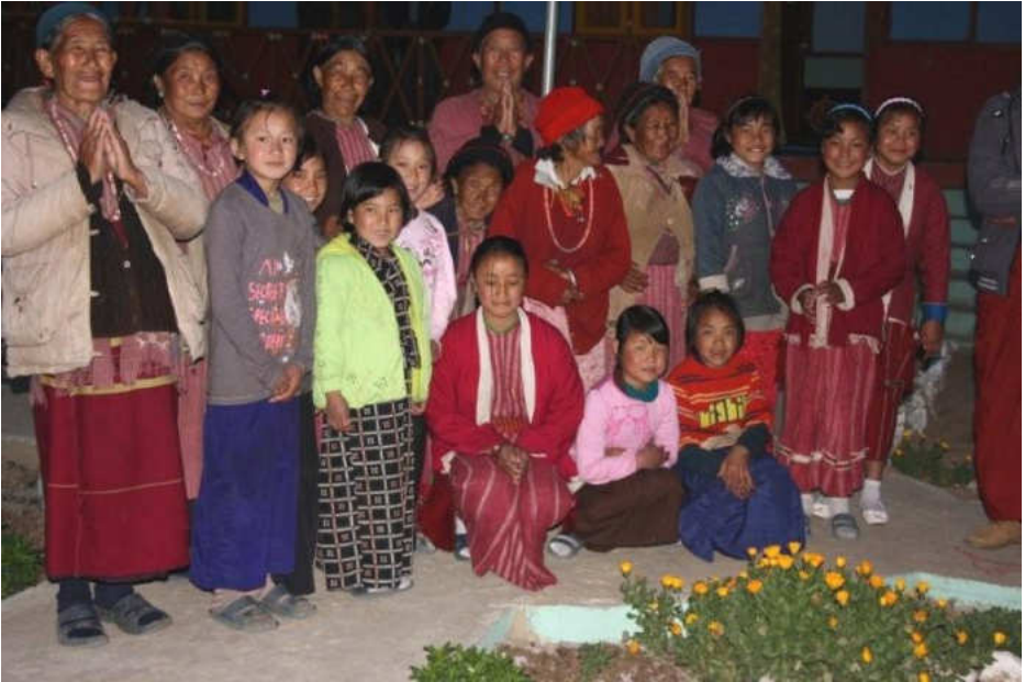
Alt und Jung zusammen