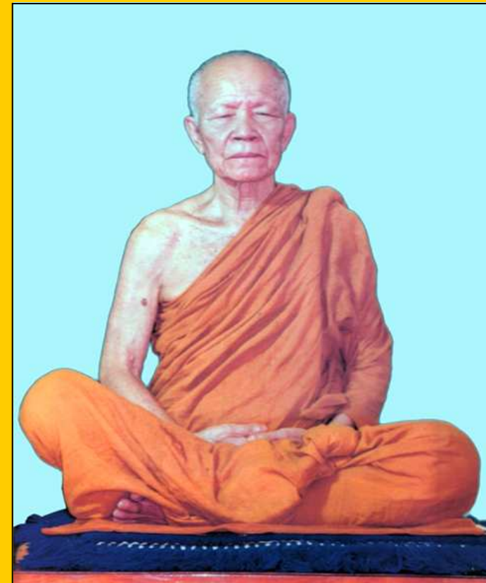
Luangta Mahā Bua: 12. August 1913 - 30. Januar 2011