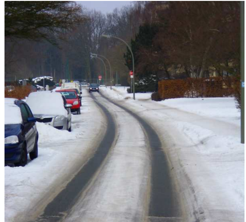
Spurrillen im Winter 2010

Denkmuster – Denkgewohnheiten – Denkschablonen.