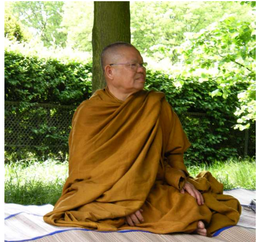
LP Sanong 2008 bei der Gedenkstätte Bullenhusen Damm